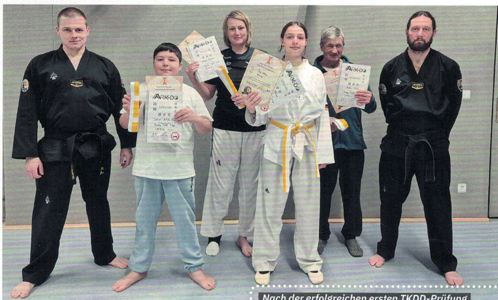
Nach der erfolgreichen ersten TKDD-Prüfung

Dass AARK-DO dabei eigenständig arbeitet, ist Teil des Profils. Die Schule gehört weder einer Dachorganisation noch einem Verein an. Andi und René sind bewusst frei unterwegs, zugleich aber mit vielen Kampfkunst-Verbänden und Personen gut vernetzt und freundschaftlich verbunden. Sie sind offizieller Standort für Taekwondo Defense und zudem Mitglied im Bundesverband Selbstverteidigung. Außerdem arbeiten sie mit der Taekwondo-Abteilung des TSV Korbach zusammen und bieten auch dort verschiedene Trainingseinheiten an.